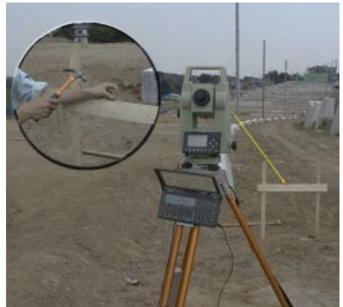
ライカ TCR307 とマスター1 で一人丁張り

マスター1 本体の PC-E650 リガード スペシャルはメーカー純正品に対して計算処理速度を2倍・容量を4倍に、また接続ケーブルをシンプルにする為に RS232C レベルコンバータを内蔵させました。