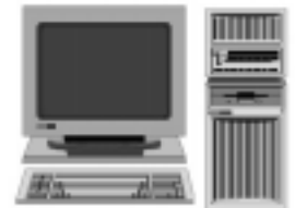
PC側の操作だけで測量データの通信が可能