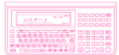
フルキ - ボード・テンキ - で快適な入力環境