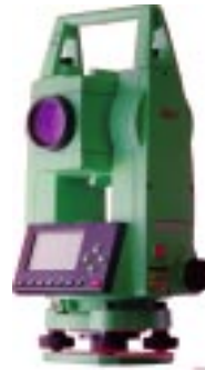
他の光波からライカへの乗換えも心配無用